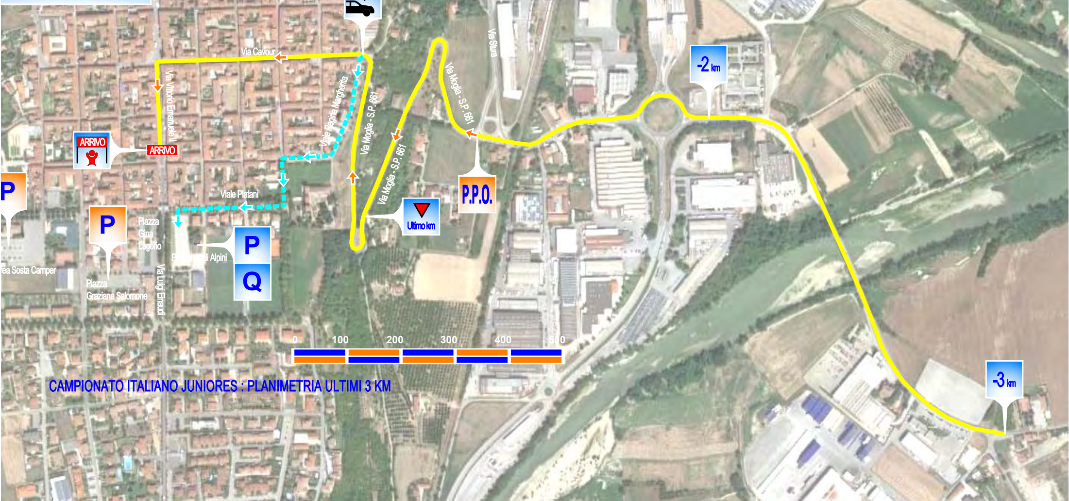
CAMPIONATO ITALIANO JUNIORES : PLANIMETRIA ULTIMI 3 KM